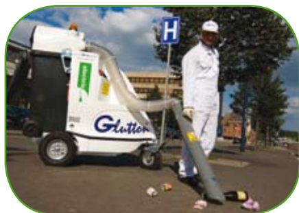
Glutton® 2211 Eléctrico