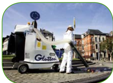
Glutton® 2211 Térmico